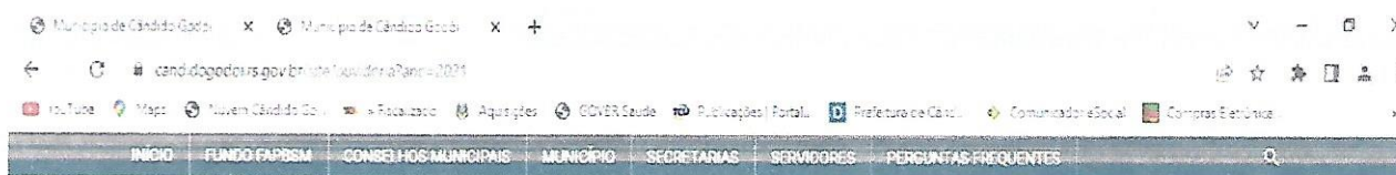
Relatório de Pedidos na Ouvidoria - Ano: 2021

No ano de 2021 foram recebidas um total de 11 manifestações. No link da Ouvidoria, na página do município de Cândido Godói, www.candidogodoi.rs.gov.br , foram recebidas 9 manifestações, o gráfico abaixo demonstra: 5 denúncias, 1 solicitação, 2 reclamações e 1 sugestão.